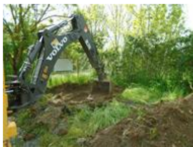
A200/B001/A260/A270 CAN - St-Hilaire-la-Palud (85)